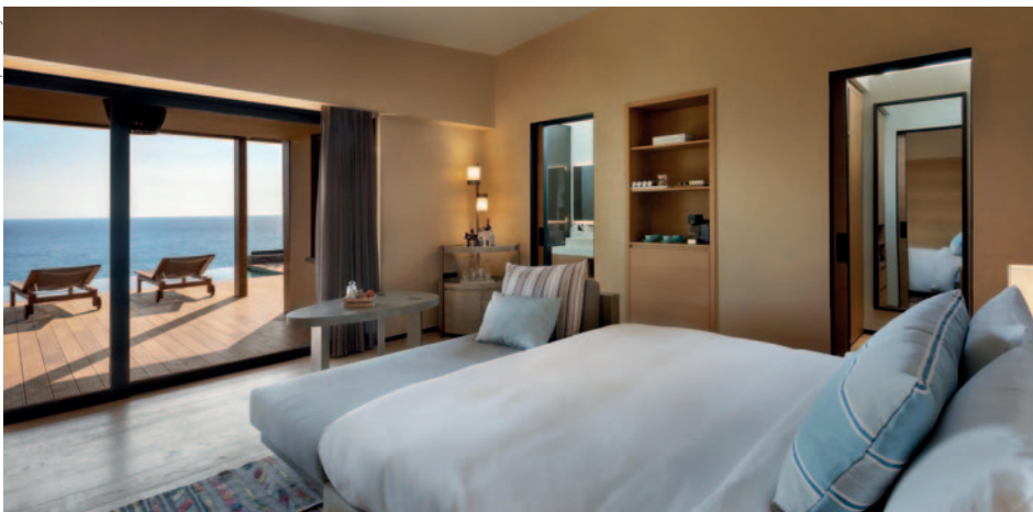
Six Senses Kaplankaya (Ridge Terrace Family Room with Pool)