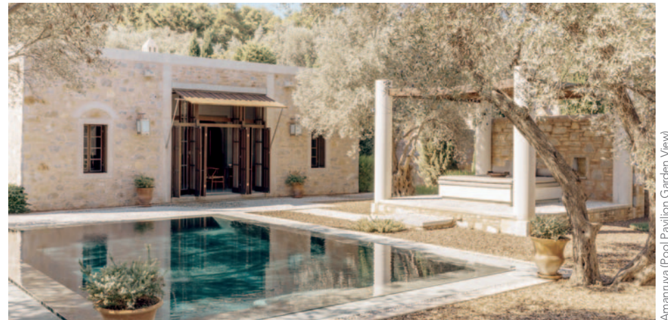
Amanruya (Pool Pavilion Garden View)

Sorprendentemente bella, la escalonada costa de la península de Bodrum evoca milenios de historia griega y romana en sitios protegidos por la Unesco, como las famosas ruinas de Éfeso y el castillo medieval de Bodrum. Para los amantes de la Historia y para quien busca relajación.