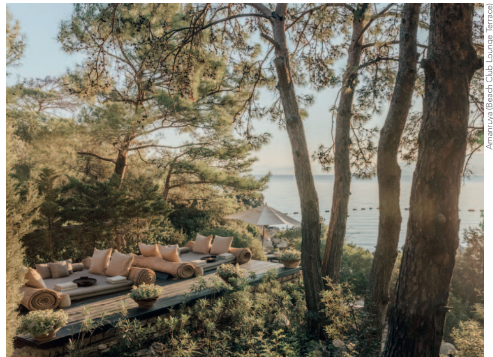
Amanruya (Beach Club Lounge Terrace)

INCLUYE - Billete de avión de Turkish Airlines en clase turista «P+Y» desde Madrid o Barcelona • 5 noches de alojamiento • Desayuno • Traslados privados aeropuerto > hotel > aeropuerto • Tasas de billete (245€).