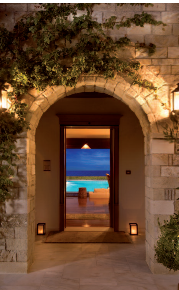
Porto Zante Villas & Spa