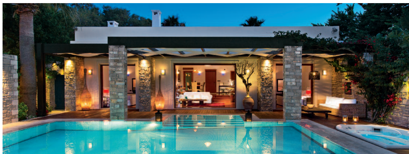
Royal Spa Villa

Una de las Islas Griegas más bellas, llena de contrastes, hogar de la famosa playa Shipwreck (Navagio) con sus inolvidables aguas turquesas, impresionantes cuevas azules y cultura influida por los venecianos, que la denominaron «Fioro di Levante» Flor del Oriente .