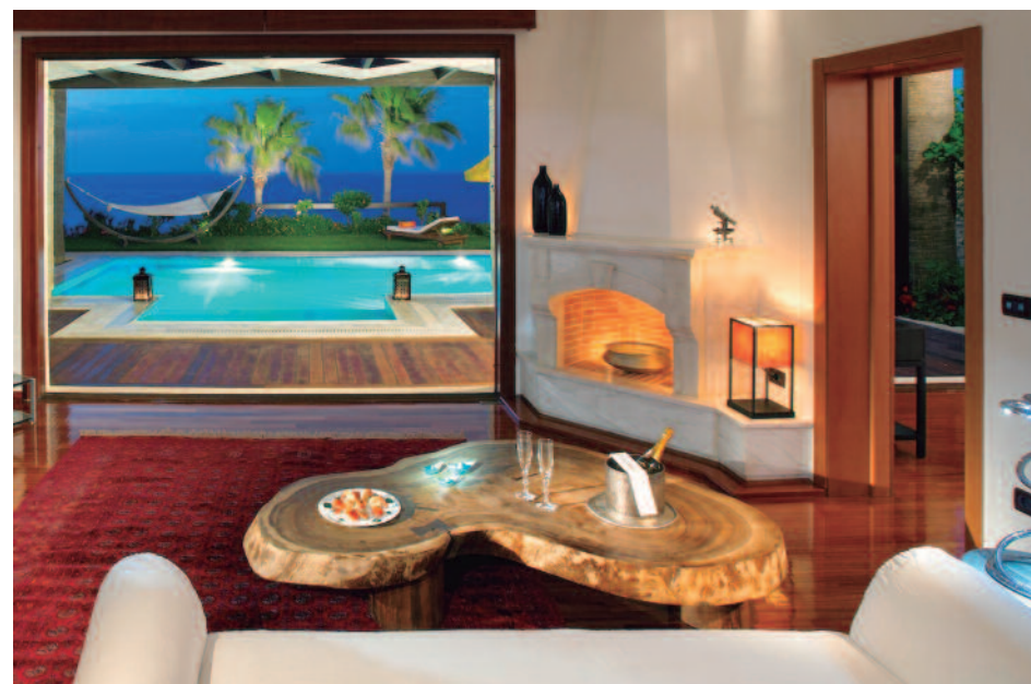
Imperial Spa Villa

Una de las Islas Griegas más bellas, llena de contrastes, hogar de la famosa playa Shipwreck (Navagio) con sus inolvidables aguas turquesas, impresionantes cuevas azules y cultura influida por los venecianos, que la denominaron «Fioro di Levante» Flor del Oriente .