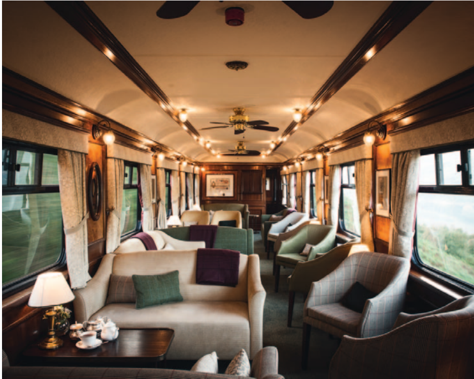
Observation Car Lounge