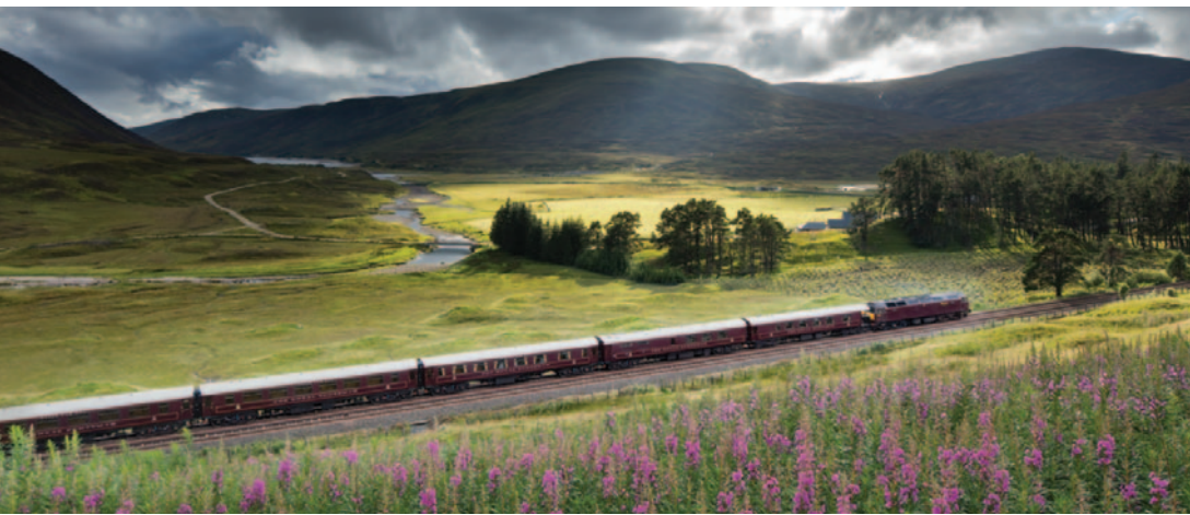
Belmond Royal Scotsman →