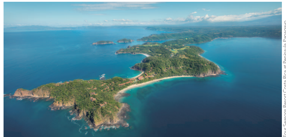
Four Seasons Resort Costa Rica at Península Papagayo