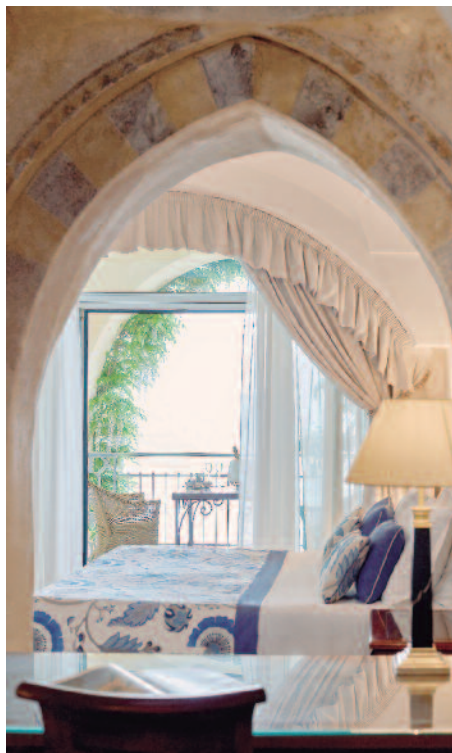
Belmond Hotel Caruso (Executive Junior Suite)