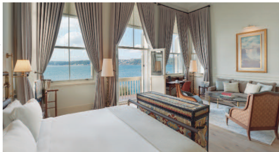
Six Senses Kocataş Mansions, Istanbul