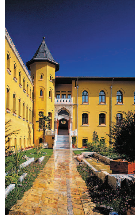
Four Seasons Hotel Istanbul at Sultanahmet

Desde 2.110€ por persona Noche extra, desde 250€ por persona (Superior Garden View Room)