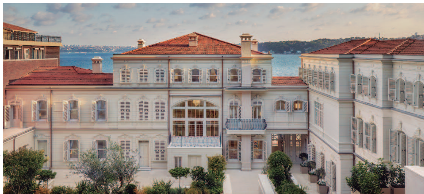
Six Senses Kocataş Mansions, Istanbul

INCLUYE - Billeto de avión de Turkish Airlines desde Madrid o Barcelona en clase turista «V» • 5 noches de alojamiento • Desayuno • Traslados privados aeropuerto > hotel > aeropuerto • Tasas de billete (165 €).