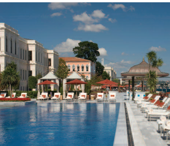
Four Seasons Hotel Istanbul at the Bosphorus (Pool)

Puente entre Oriente y Occidente, entre Europa y Asia. Tan cerca y tan lejos. Tan igual y tan distinta. Huellas romanas, otomanas, cristianas y musulmanas. Historia y modernidad. Cultura y bazares. Estambul nos espera, siempre.