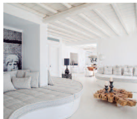
Myconian Villas Collection

INCLUYE - Billeto de avión de Aegean Airlines en clase turista «T» desde Madrid y Vueling desde Barcelona en clase turista «O» • 5 noches de alojamiento • Desayuno • Traslados privados aeropuerto > hotel > aeropuerto • Tasas de billete (85 €).