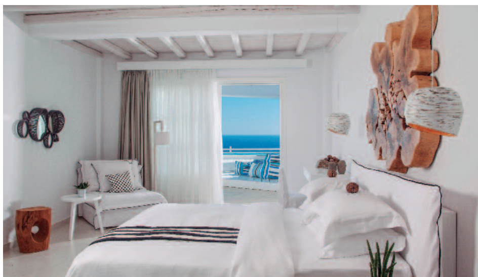
Myconian Villas Collection (Prestige)

Desde 1.515€ por persona Noche extra, desde 210€ por persona (Signature Retreat Private Pool)