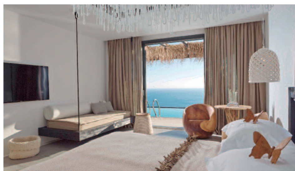
Myconian Utopia (Signature Retreat)

Calas solitarias idóneas para el buceo y otras perfectas para tumbarse al sol. El aroma a buganvilla le acompañará mientras pasea por Chora, la Pequeña Venecia, donde sus blancos callejones contrastan con el azul de las puertas y ventanas.