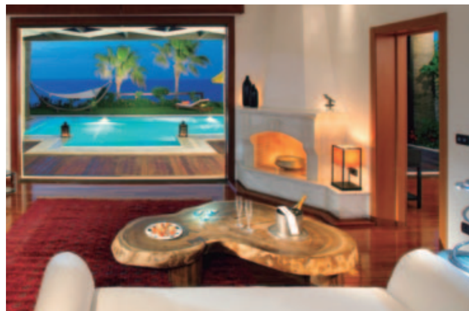
Imperial Spa Villa

Una de las Islas Griegas más bellas, llena de contrastes, hogar de la famosa playa Shipwreck (Navagio) con sus inolvidables aguas turquesas, impresionantes cuevas azules y cultura influida por los venecianos, que la denominaron «Fiore di Levante» Flor de Oriente.