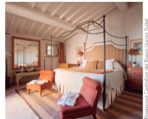
Rosewood Castiglion del Bosco (Junior Suite)