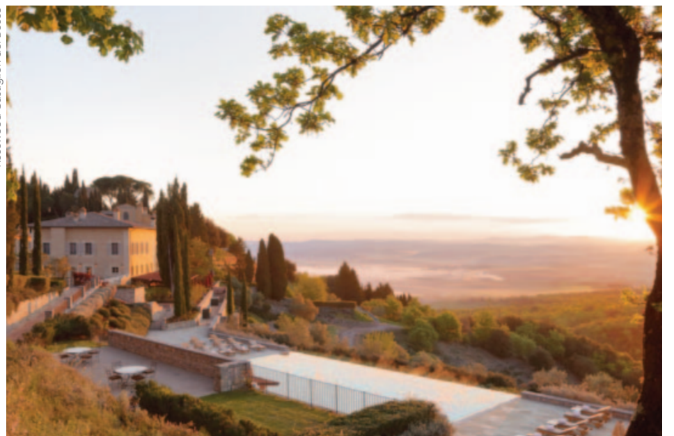
Rosewood Castiglion del Bosco