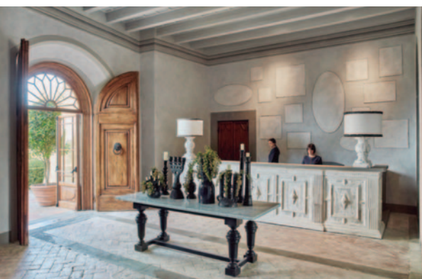
COMO Castello del Nero (Reception)