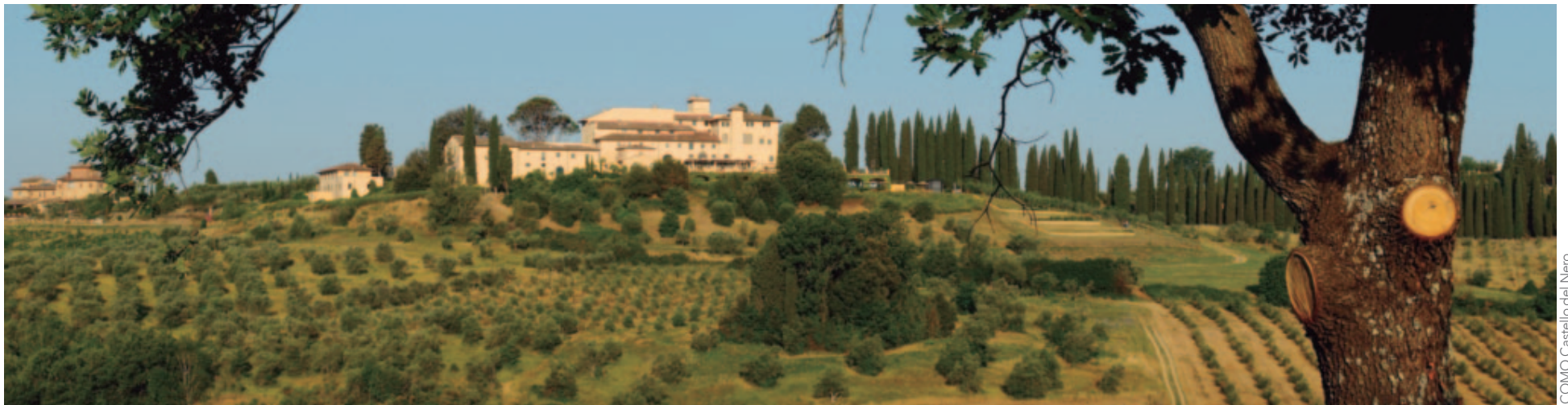
COMO Castello del Nero