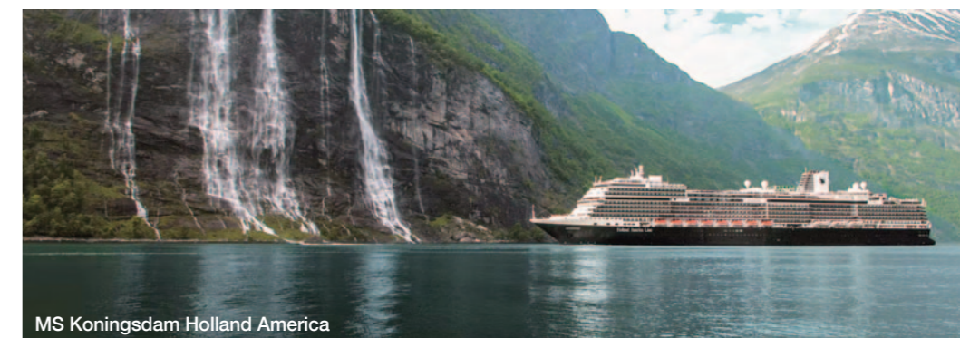
MS Koningsdam Holland America

Glaciares azul cobalto y fiordos primitivos. Orcas que emergen y nutrias que juegan. Águilas calvas volando en el aire y osos negros alimentándose en el suelo.