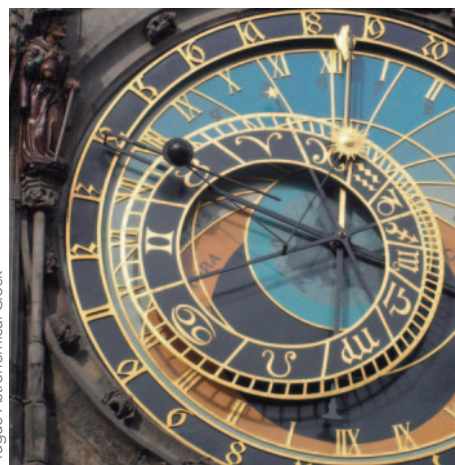
Prague Astronomical Clock