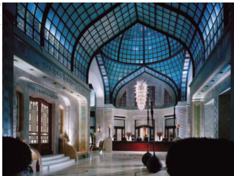
Four Seasons Hotel Gresham Palace Budapest (Lobby)

7 días visitando Praga , la ciudad de las cien agujas, con su espectacular arquitectura gótica; la monumental, elegante y señorial Viena que hace viajar a otros tiempos y Budapest , que une su encanto como destino clásico con nuevos barrios de moda.