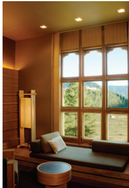
Amankora Gangtey (Suite Lounge)

INCLUYE - Billete de avión de Qatar Airways en clase turista «N» • 11 noches de alojamiento (Six Senses en media pensión, bebidas no alcohólicas, minibar sin alcohol); (Aman Journey en pensión completa, bebidas no alcohólicas, minibar sin alcohol, un tratamiento de spa en Amankora) • Servicios privados con guías locales de habla inglesa • Tasas y visado de entrada a Bhutan • Tasas de billete (365€).