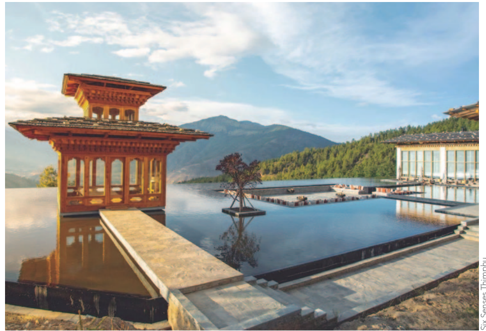
Six Senses Thimphu