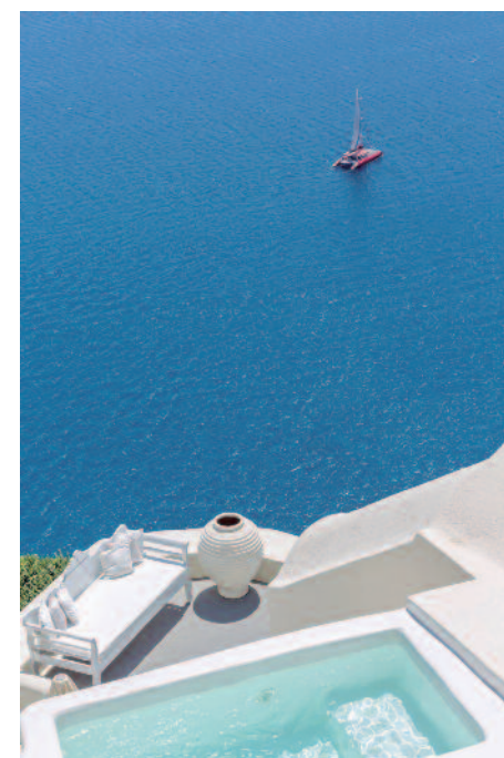
Canaves Oia Suites

Desde 1.990€ por persona Noche extra, desde 295€ por persona (Junior Suite Plunge Pool Caldera Sea View)