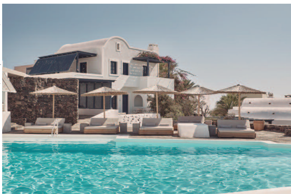
Vedema, a Luxury Collection Hotel, Santorini

INCLUYE - Billete de avión de Aegean Airlines en clase turista «T» desde Madrid y Vueling desde Barcelona en clase turista «O» • 5 noches de alojamiento • Desayuno • Traslados privados aeropuerto > hotel > aeropuerto • Tasas de billete (85 €).