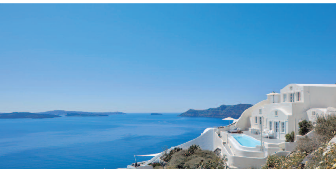
Canaves Oia Suites