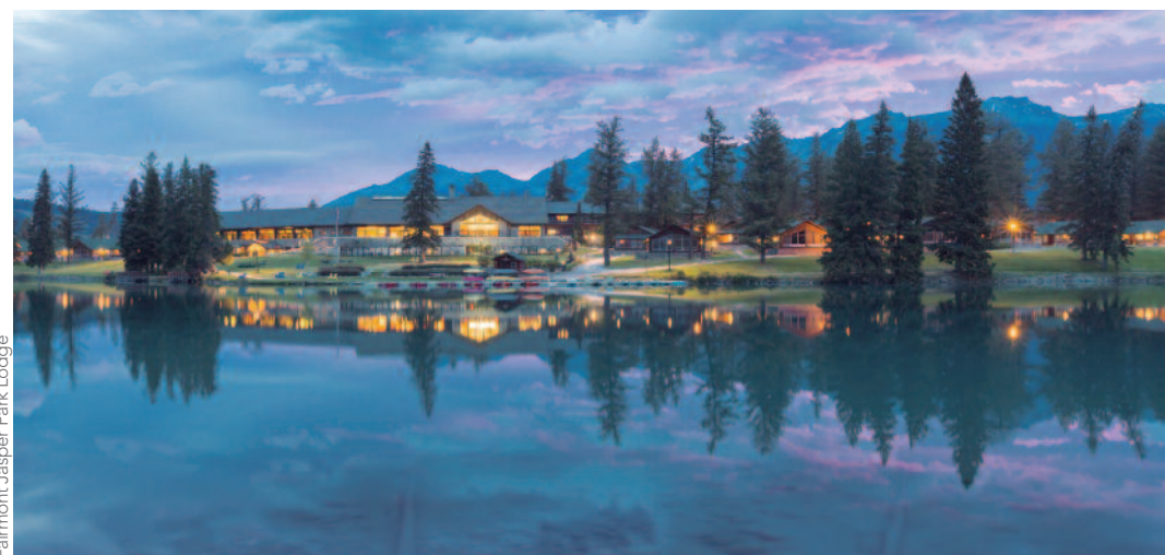
Fairmont Jasper Park Lodge

Situada en un archipiélago de pequeñas islas entre Vancouver y el territorio continental de Columbia Británica, la isla de Sonora toma su nombre de una e las goletas españolas que exploró el noroeste del Pacífico en 1775. Se accede por mar o aire y es un auténtico paraíso para la pesca del salmón y para observar osos Grizzly, orcas, leones marinos y delfines.