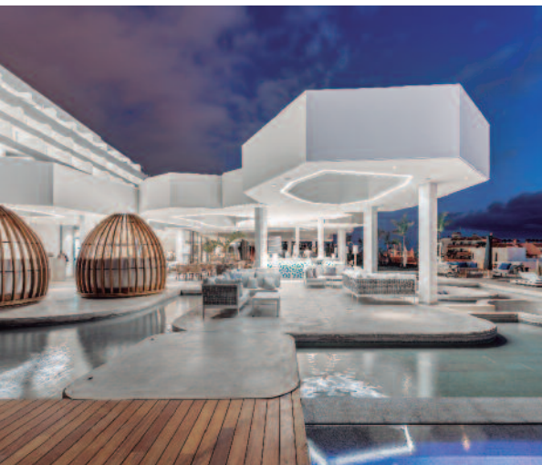
Royal Hideaway Corales Beach

INCLUYE - Billete de avión de Iberia desde Madrid y Vueling desde Barcelona en clase turista «O» • 5 noches de alojamiento • Desayuno • Traslados privados aeropuerto > hotel > aeropuerto • Tasas de billete (30 €).