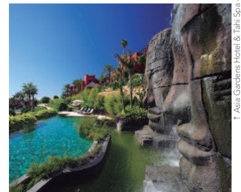
↑ Asia Gardens Hotel & Thai Spa →