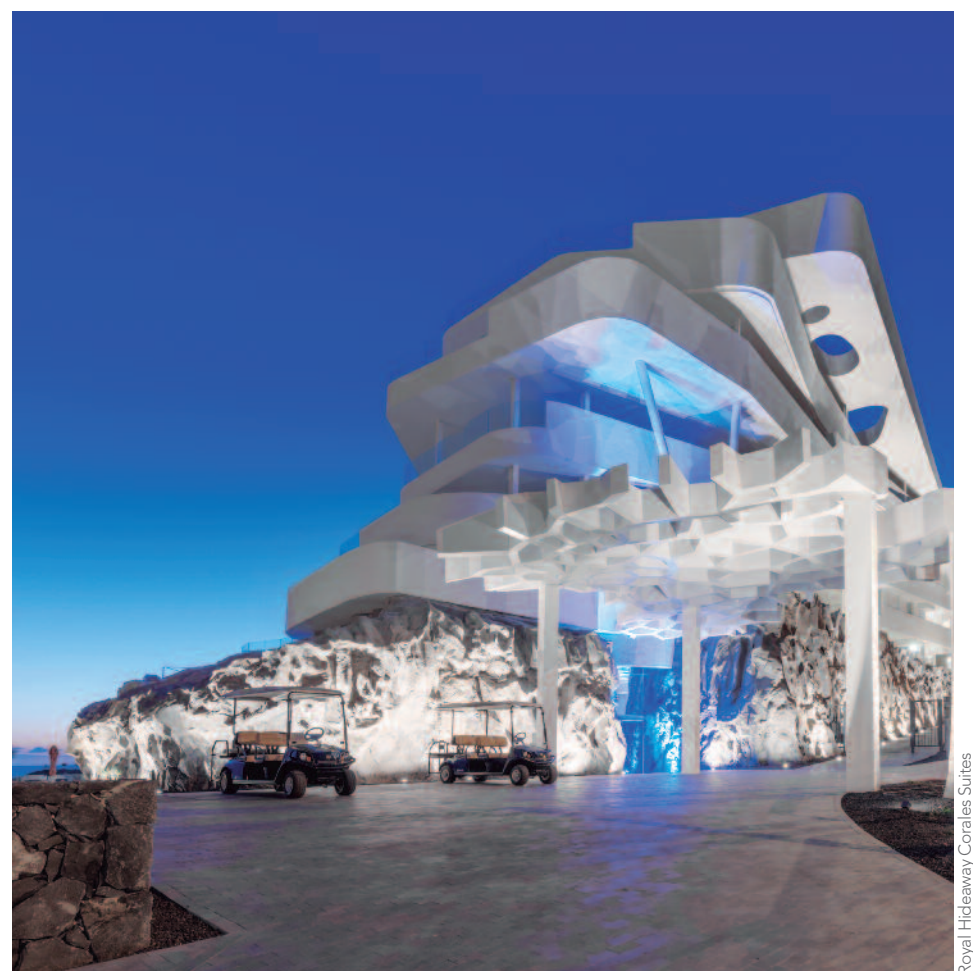
Royal Hideaway Corales Suites