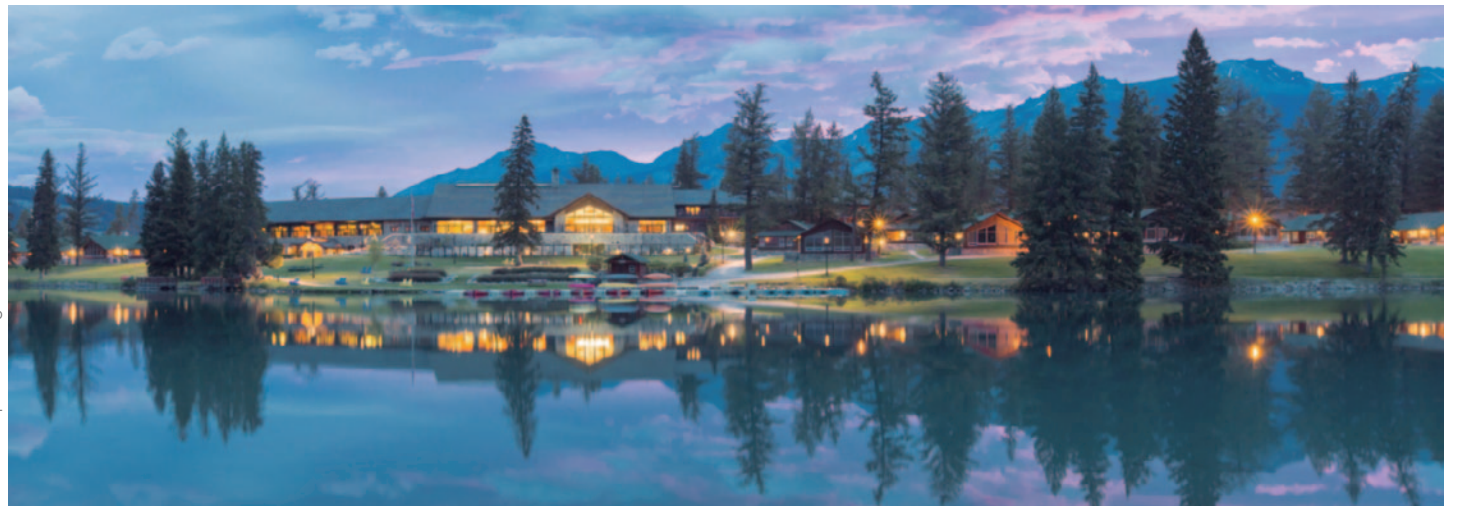
Fairmont Jasper Park Lodge