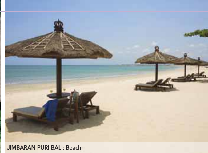
JIMBARAN PURI BALI: Beach