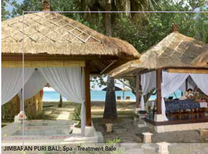
JIMBARAN PURI BALI: Spa - Treatment Bale