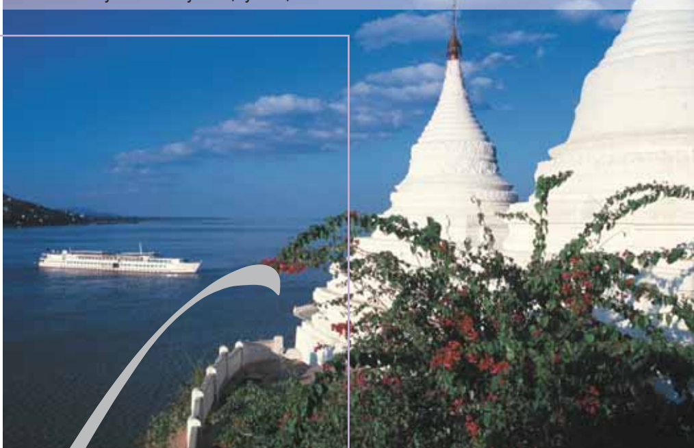
Road to Mandalay from Shwe Kyet Yet (Myanmar)