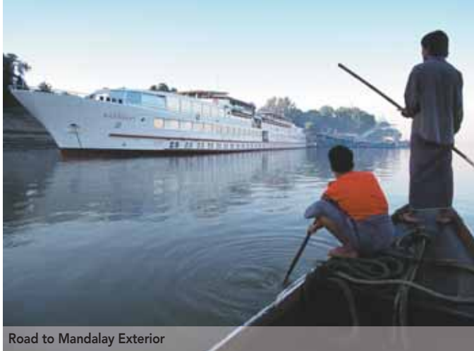
Road to Mandalay Exterior