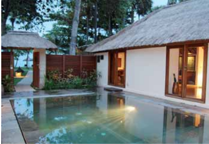
Beach Front Pool Cottage Suite