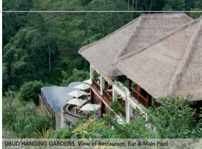
UBUD HANGING GARDENS: View of Restaurant, Bar & Main Pool