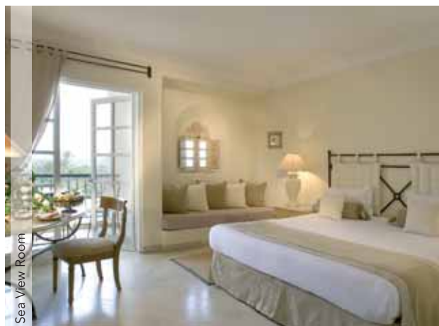
Sea View Room

tradicional. Por último, Neroli, en el centro de talasoterapia, ofrece especialidades dietéticas. La playa del hotel es amplia y bien equipada, disponiendo de sombrillas, tumbonas y un bar.