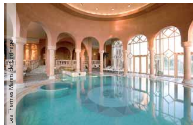
Les Thermes Marins de Carthage