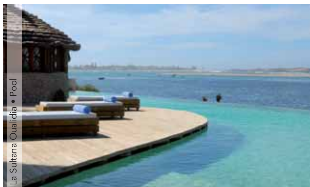
La Sultana Oualidia • Pool