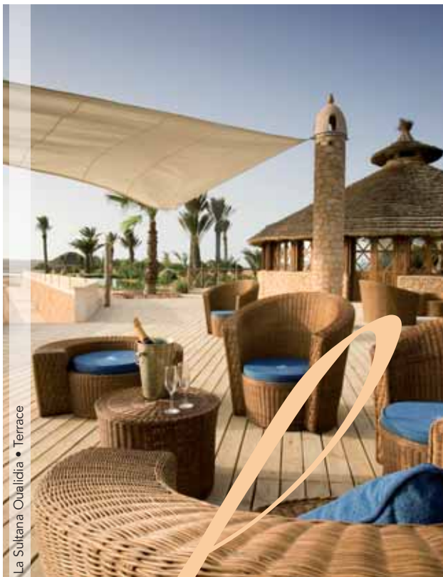
La Sultana Oualidia • Terrace