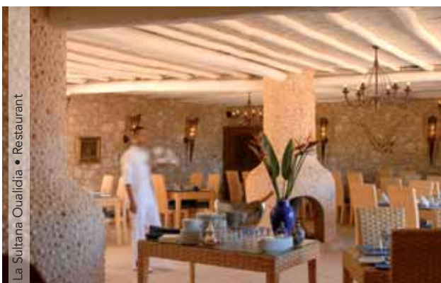
La Sultana Oualidia • Restaurant

Este hotel-spa se sitúa en una zona muy apreciada por los marroquíes debido a su maravilloso entorno natural, e incluso el rey Mohammed V construyó un palacio en las inmediaciones. Inaugurado en 2007, combina el estilo tradicional de una kasbah con techados de paja que le otorgan un carácter tropical. El elemento más destacable de La Sultana Hotel & Spa Oualidia es su infinita piscina rodeada de tumbonas. Cada habitación tiene vistas a la laguna, y muchas disponen de terraza privada con un jacuzzi de agua de mar. Su moderno equipamiento le confiere un toque de lujo y modernidad, mientras que el mármol, las chimeneas, las antigüedades, las pinturas y los objetos de arte le otorgan elegancia. En el capítulo gastronómico, La Sultana Hotel & Spa Oualidia se convierte en un paraíso para los gourmets, donde podrá degustar el más fresco pescado y marisco. Para lograr una relajación total, podrá pasear por la playa privada y disfrutar de los cinco jacuzzis de agua de mar situados alrededor de la piscina. El spa cuenta con un gimnasio, piscina interior ionizada y climatizada y hammams en los que poder deleitarse de diversos tratamientos holísticos y de aromaterapia.