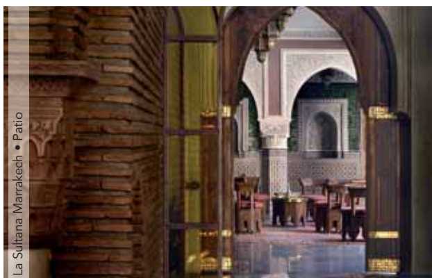
La Sultana Marrakech • Patio

PRECIOS POR PERSONA EN HAB. DOBLE - TASAS DE BILLETE INCLUIDAS Desde Barcelona y Madrid. Alojamiento y desayuno.