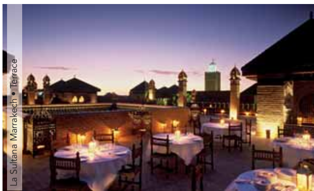
La Sultana Marrakech • Terrace