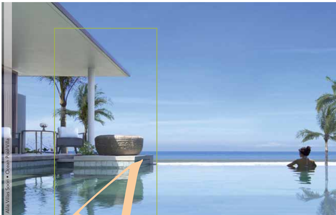
Alila Villas Soori • Ocean Pool Villa