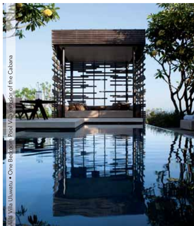
Alila Villa Uluwatu • One Bedroom Pool Villa exterior of the Cabana

Billetes de avión de Qatar Airways en clase turista «H» Salida desde Madrid o Barcelona Traslados privados Desayunos diarios Tasas de billete (170 €).