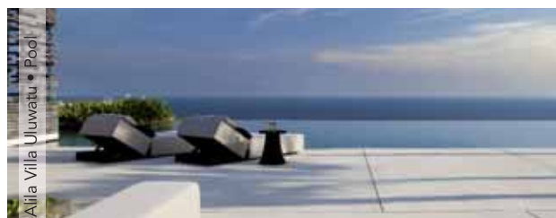
Alila Villa Uluwatu • Pool