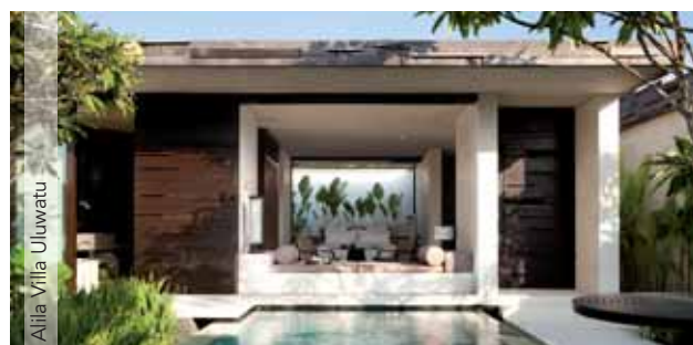
Alila Villa Uluwatu