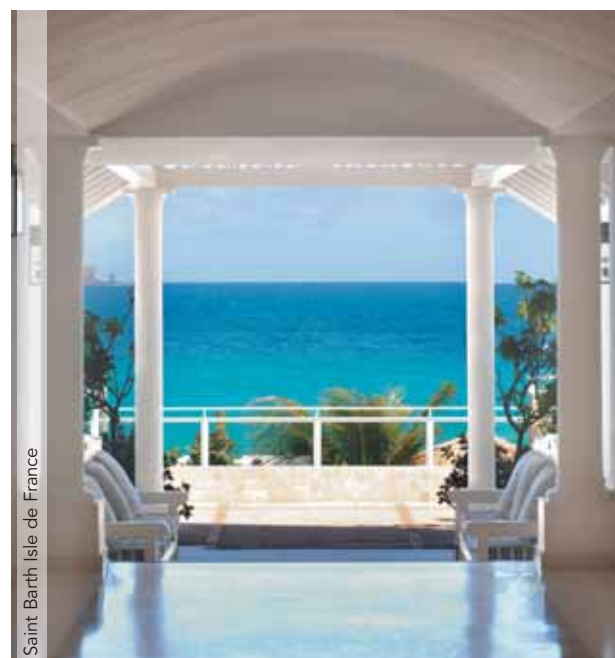
Saint Barth Isle de France

Consultar precios a partir del 20 Diciembre