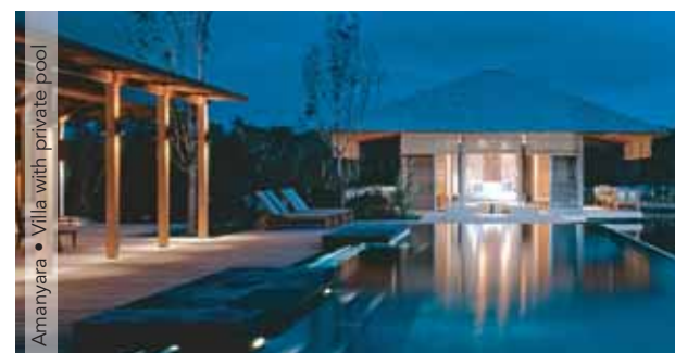
Amanyara • Villa with private pool