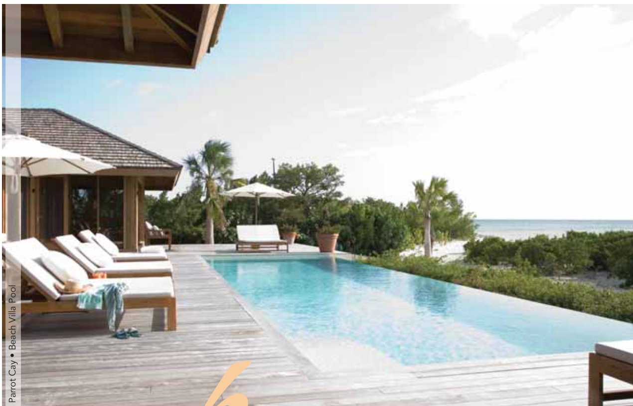
Parrot Cay • Beach Villa Pool