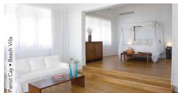
Parrot Cay • Beach Villa