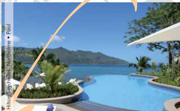
Hilton Seychelles Northolme • Pool