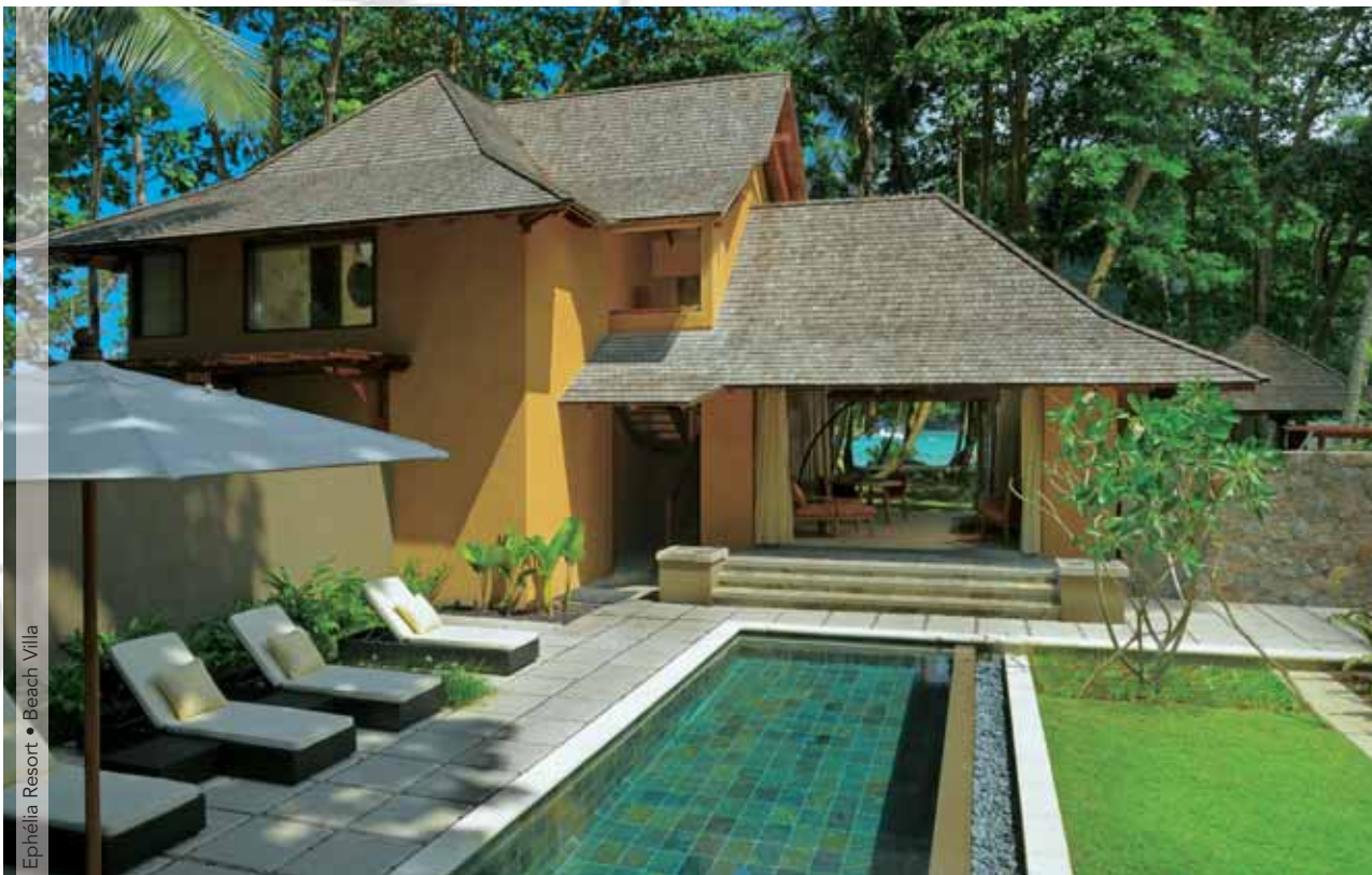
Ephélie Resort • Beach Villa