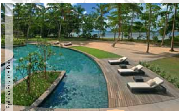
Ephélie Resort • Pool