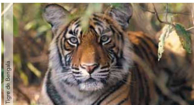
Tigre de Bengala

Los lodges permanecerán cerrados de Julio a Octubre, excepto Pashan Garh Panna Wilderness Lodge, abierto todo el año. Consultar precios a partir de Noviembre.