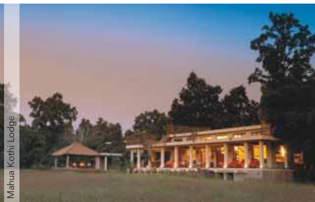
Mahua Kothi Lodge