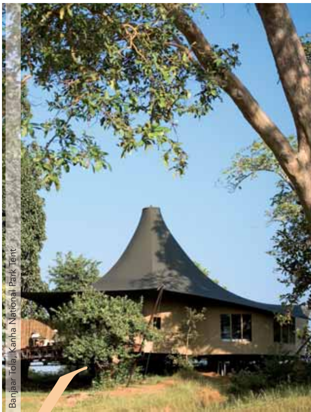
Banjaar Tola, Kanha National Park Tent