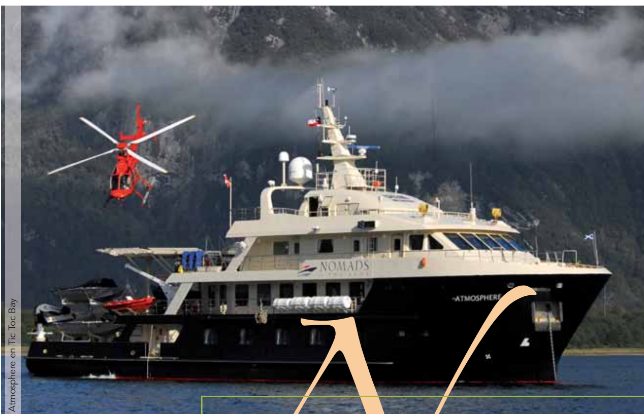
Atmosphere en Tic Toc Bay