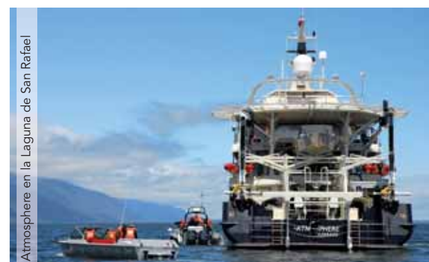
Atmosphere en la Laguna de San Rafael