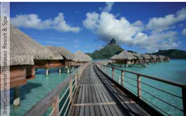
InterContinental Thalasso Resort & Spa