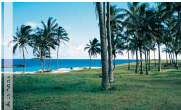
Isla de Pascua