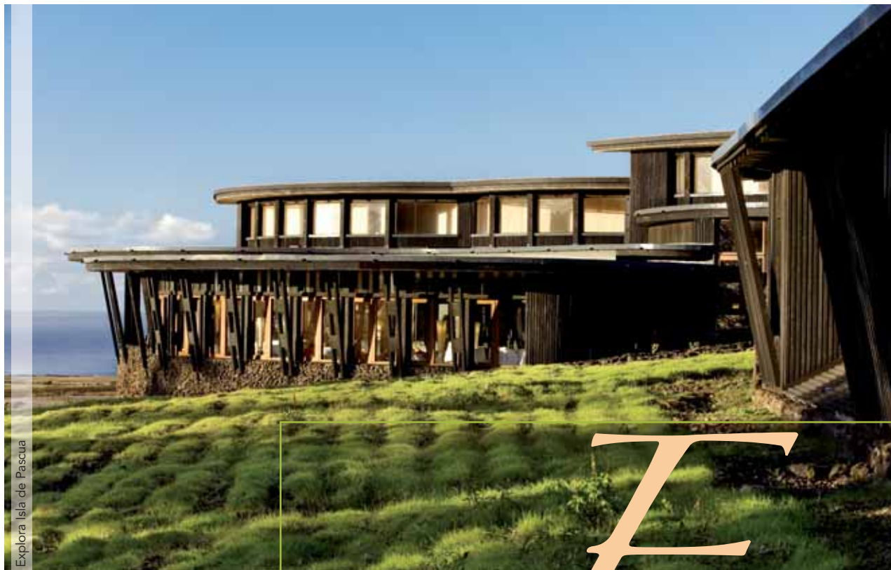
Explora Isla de Pascua