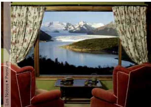
Los Notros • Premium

Día 11. España. Llegada y fin de nuestros servicios.