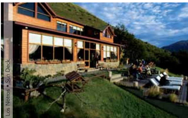
Los Notros • Sun Deck