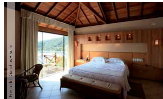
Ponta dos Ganchos • Suite