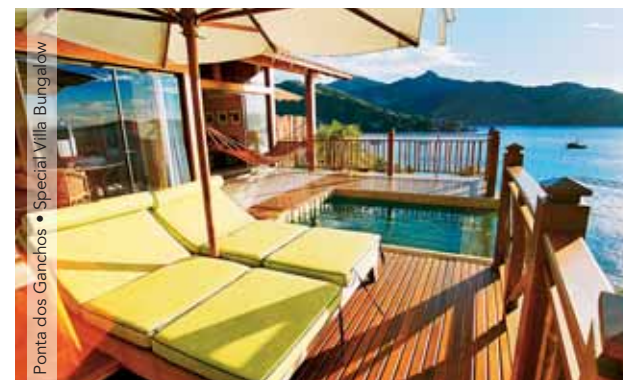
Ponta dos Ganchos • Special Villa Bungalow