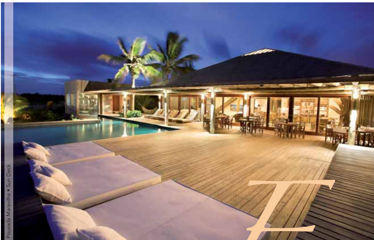
Pousada Maravilha • Sun Deck