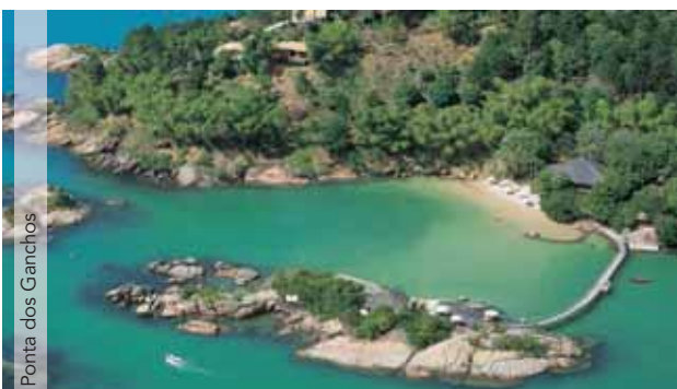
Ponta dos Ganchos

Un proyecto del Arquitecto Thiago Bernardes, con colores claros, luz natural. La Pousada sorprende a los huéspedes con detalles y servicios que permiten disfrutar lo mejor de un paraíso ecológico, al mismo tiempo en que se es tratado como si estuviese en un hotel 5 estrellas. Profesionales con experiencia internacional fueron cuidadosamente seleccionados para dejar al huésped bien atendido sin interferir en su intimidad, sirviéndolo siempre de la mejor manera posible.