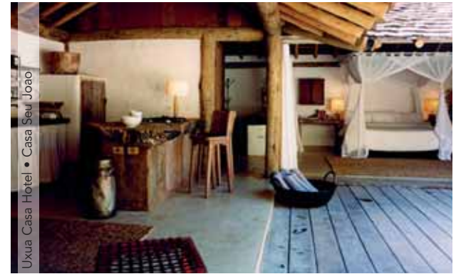
Uxua Casa Hotel • Casa Seu Joao