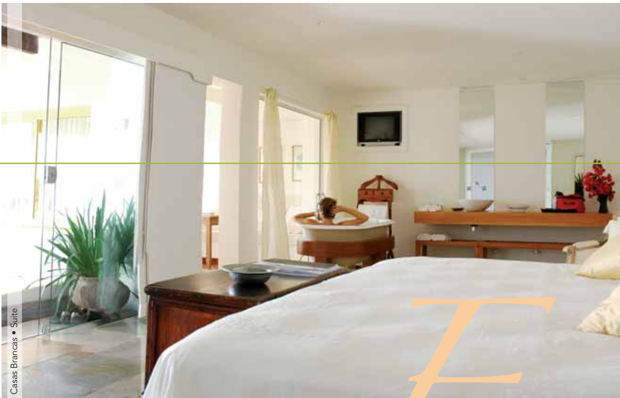
Casas Brancas • Suite