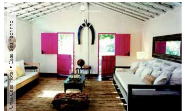
Uxua Casa Hotel • Casa Seu Pedrinho