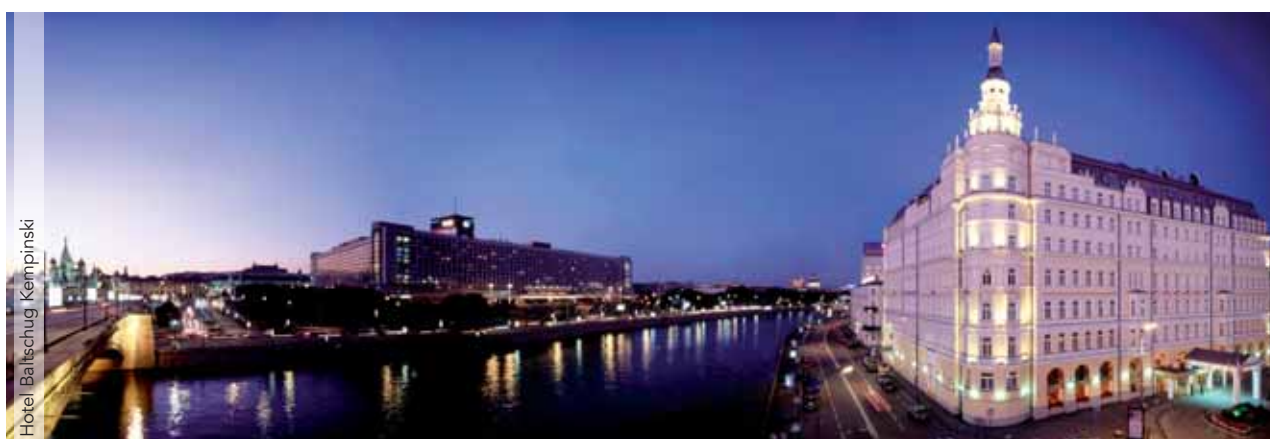
Hotel Baltshug Kempinski

Billete de avión de Lufthansa en clase turista «W» ➤ Tres noches de estancia en Moscú y 4 noches de estancia en San Petersburgo en la combinación de hoteles elegida, con desayuno ➤ Visitas con guías locales de habla castellana ➤ Tren expreso Moscú/San Petersburgo en primera clase ➤ Traslados en servicio privado ➤ Tasas de billete (193 €).