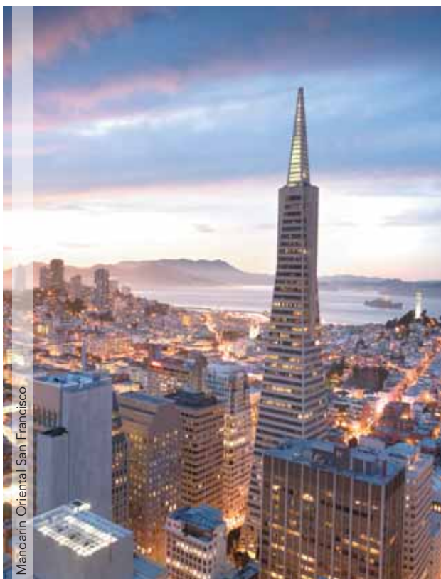
Mandarin Oriental San Francisco