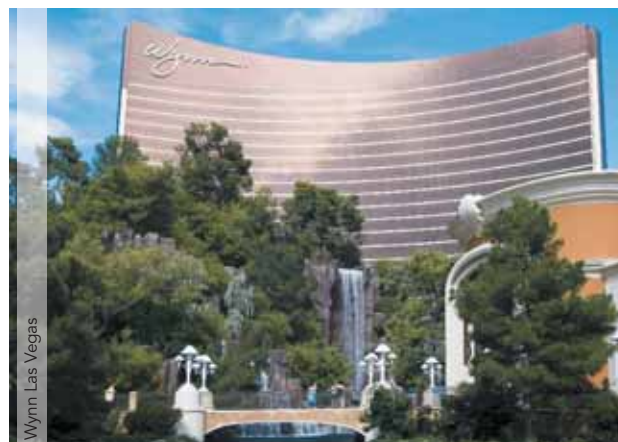
Wynn Las Vegas

Día 10. España. Llegada y fin de nuestros servicios.