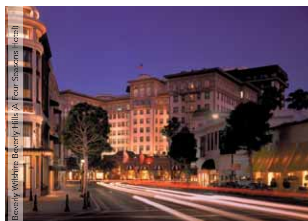
Beverly Wilshire Beverly Hills (A Four Seasons Hotel)

PRECIOS POR PERSONA EN HAB. DOBLE - TASAS DE BILLETE INCLUIDAS Precio base desde Barcelona y Madrid 4.150