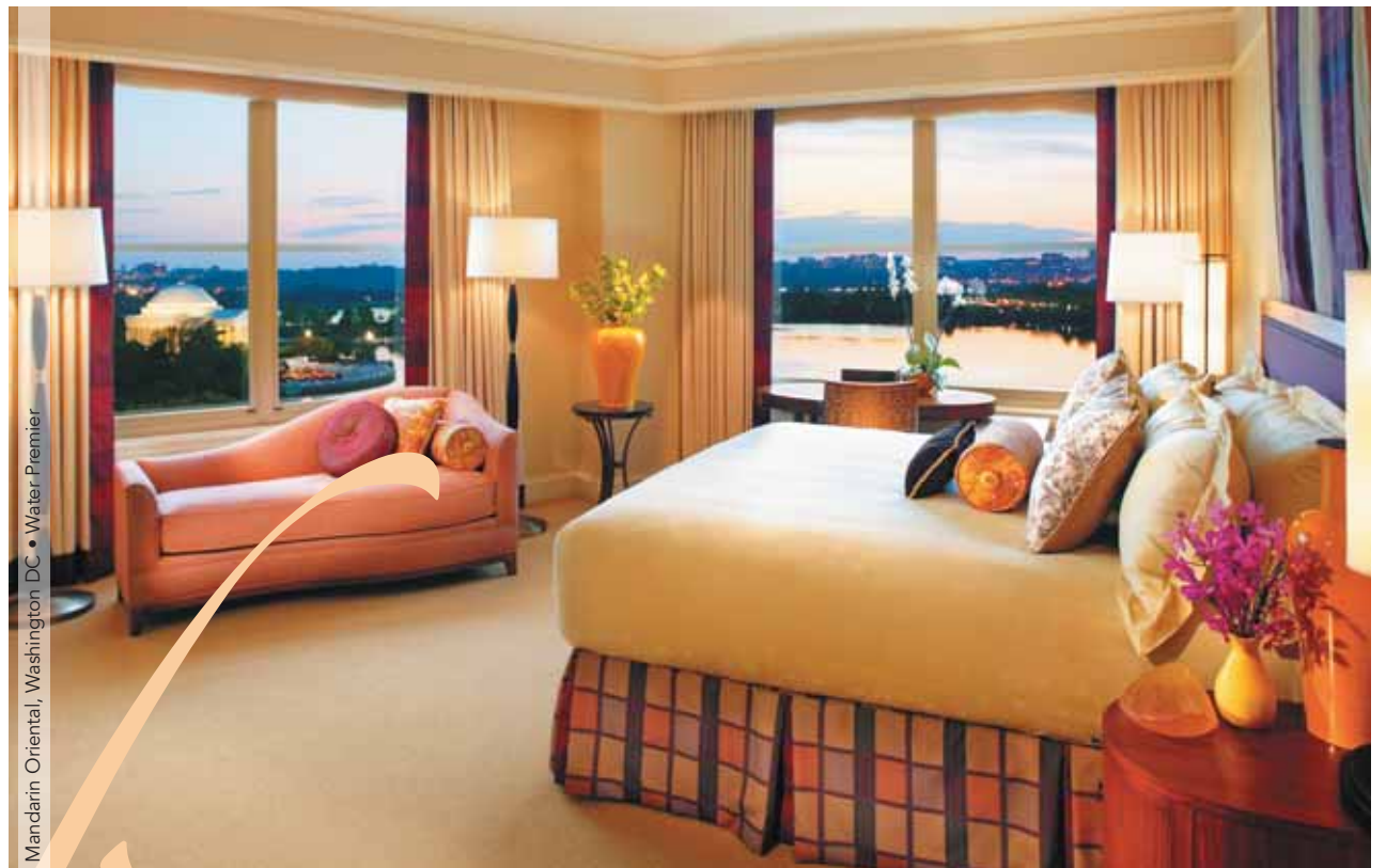
Mandarin Oriental, Washington DC • Water Premier