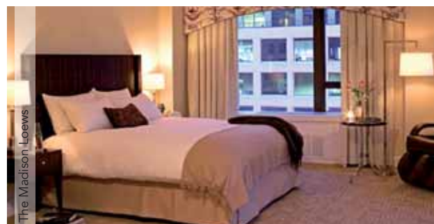
The Madison Loews

Billete de avión de Delta Airlines, clase turista «U» ➤ Dos noche de estancia en el hotel elegido, en régimen de sólo alojamiento ➤ Traslados y visita de la ciudad en servicio privado.