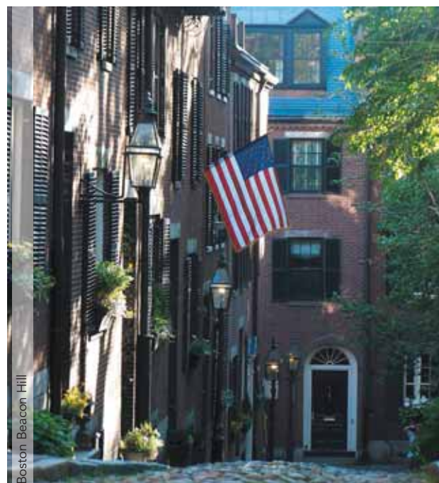
Boston Beacon Hill