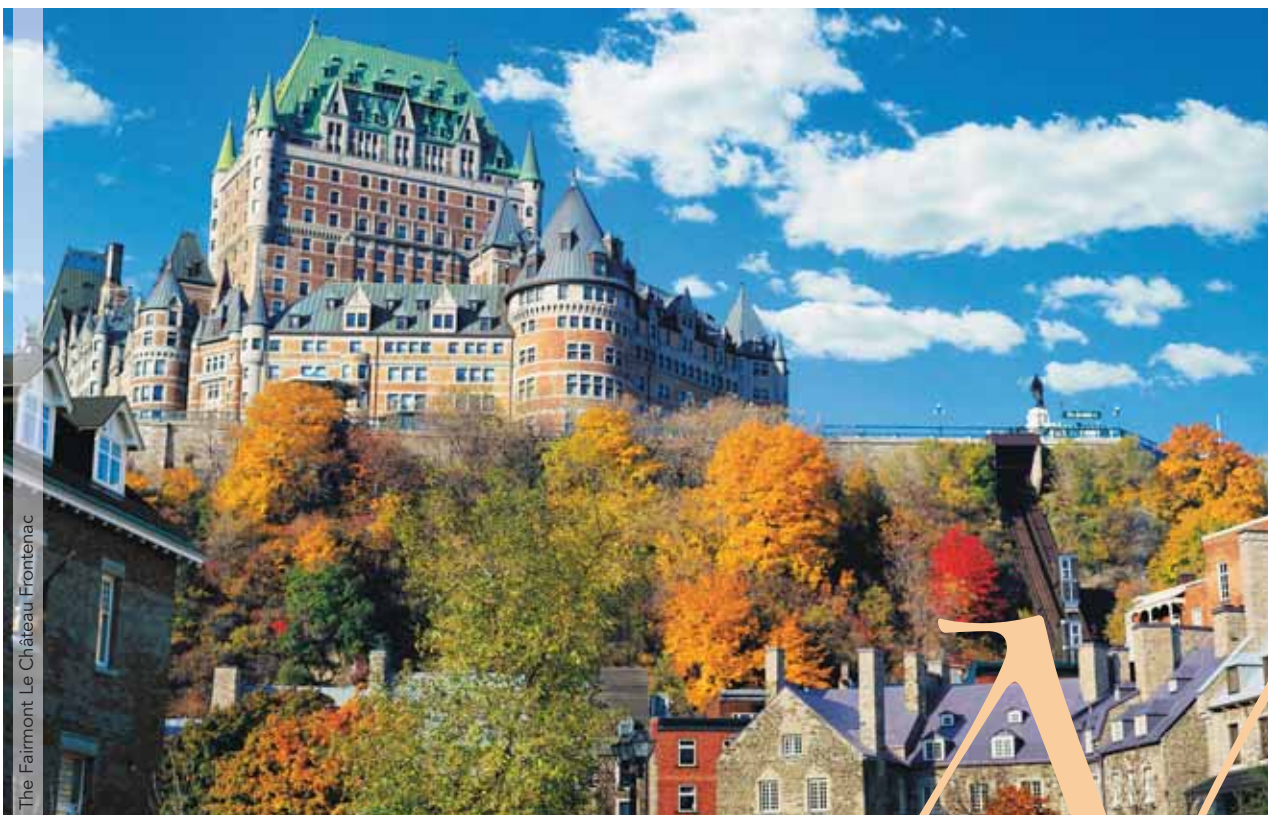
The Fairmont Le Château Frontenac