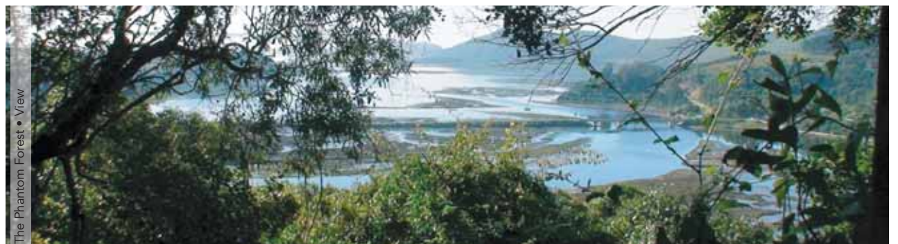
The Phantom Forest • View