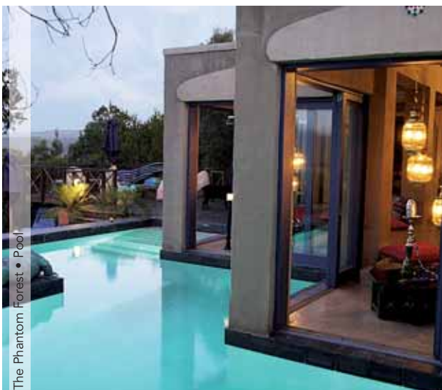
The Phantom Forest • Pool

4 días de coche de alquiler grupo BS (mín. 2 personas) tipo VW Polo Classic o grupo V (mín. 4 personas) tipo Toyota Verso ➤ Kilometraje ilimitado ➤ Seguro obligatorio de robo, colisión y ocupantes ➤ 3 noches de alojamiento y desayuno según opción.