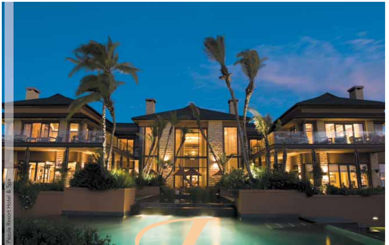
Pezula Resort Hotel & Spa