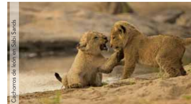
Cachorros de león en Sabi Sands

Día 12. España. Llegada y fin de nuestros servicios.