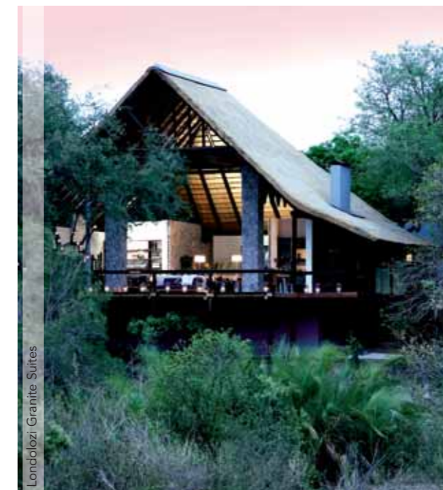
Londolozzi Granite Suites