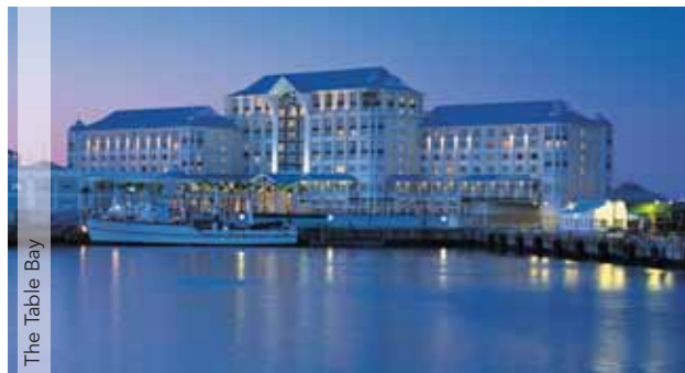
The Table Bay

CIUDAD DEL CABO ▶ KRUGER ▶ JOHANNESBURGO ▶ CATÁRATAS VICTORIA