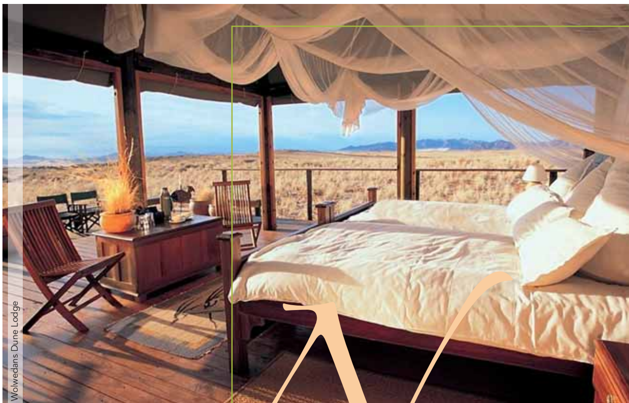
Wolwedans Dune Lodge