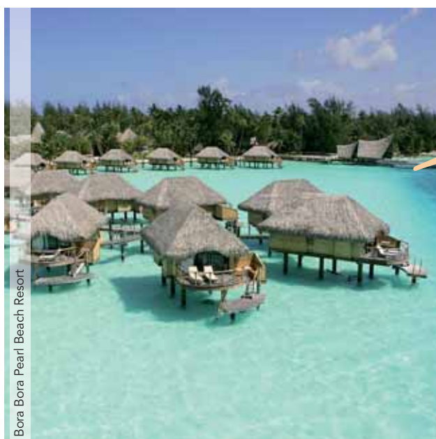
Bora Bora Pearl Beach Resort

Día 1. España ▶ Osaka. Salida en vuelo regular con destino Osaka vía una ciudad europea. Noche a bordo.