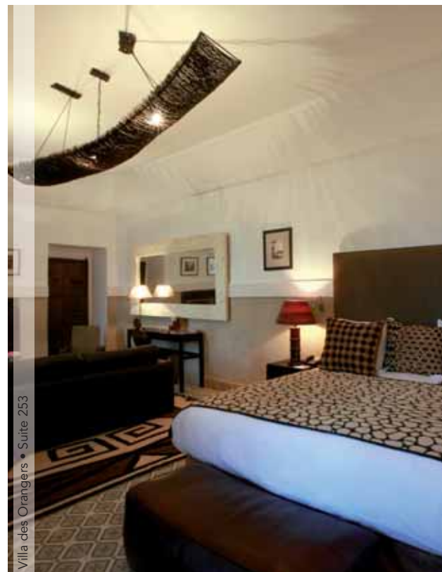
Villa des Orangers • Suite 253