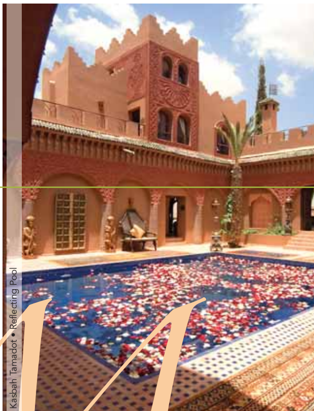
Kasbah Tamadot • Reflecting Pool