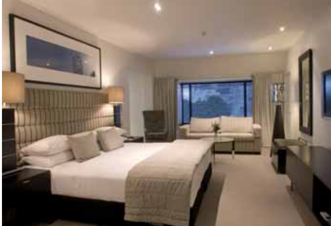
CHRISTCHURCH: The George • Junior Suite