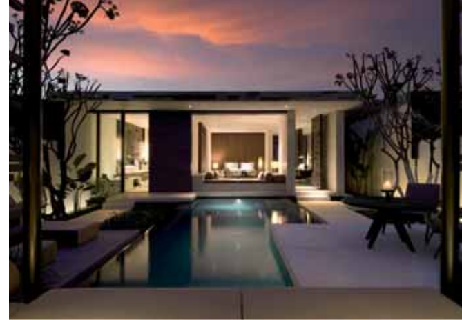
BALI: Alila Villas Uluwatu