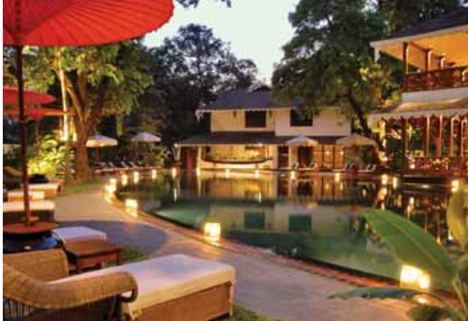
MYANMAR: Governor's Residence • Pool Area