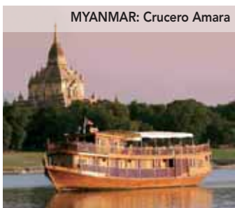
MYANMAR: Crucero Amara