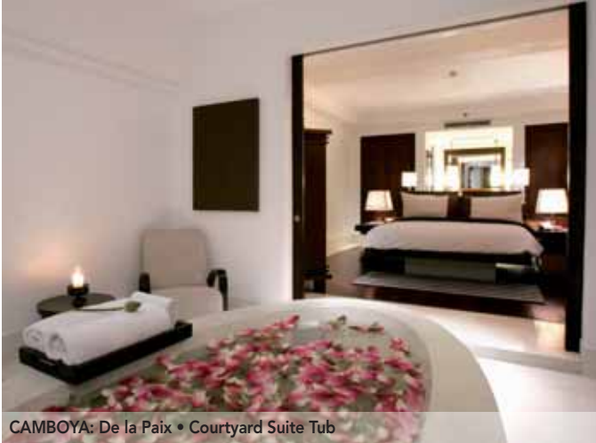
CAMBOYA: De la Paix • Courtyard Suite Tub