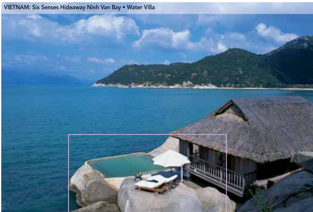
VIETNAM: Six Senses Hideaway Ninh Van Bay • Water Villa