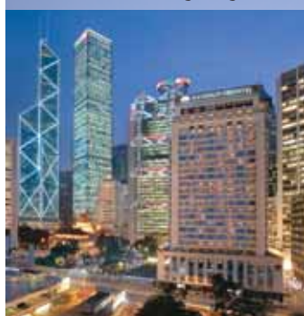
Mandarin Oriental Hong Kong