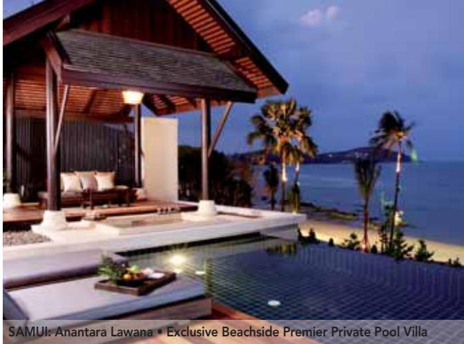
SAMUI: Anantara Lawana • Exclusive Beachside Premier Private Pool Villa