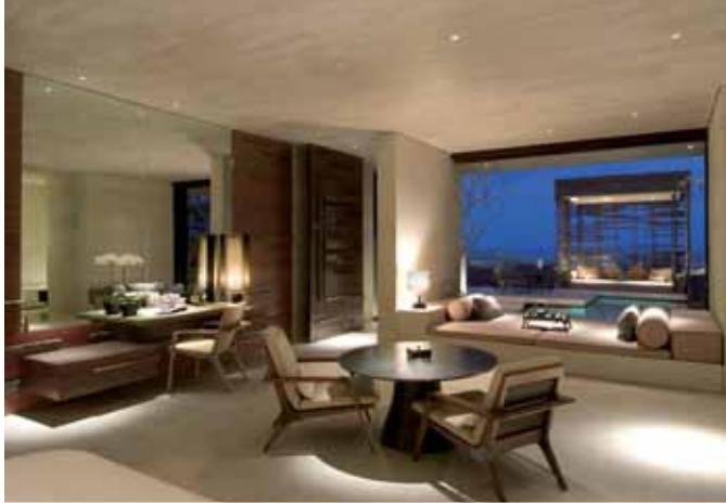
BALI: Alila Villas Uluwatu