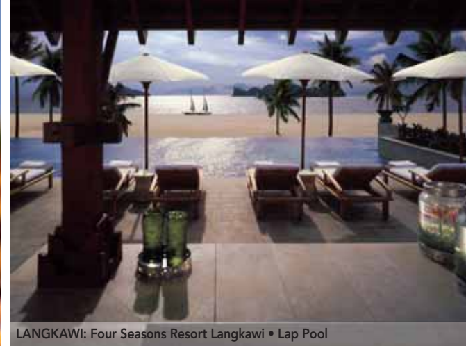
LANGKAWI: Four Seasons Resort Langkawi • Lap Pool