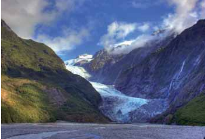
NEW ZEALAND: Franz Josef Glacier