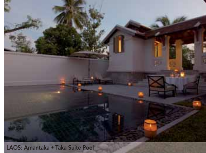
LAOS: Amantaka • Taka Suite Pool